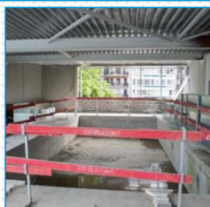
La nouvelle piscine (10 m sur 5) pour les clients de l'hôtel et le club Kineo.