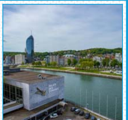
La vue sur la Meuse depuis le Sky Bar situé au dixième étage de l'hôtel.