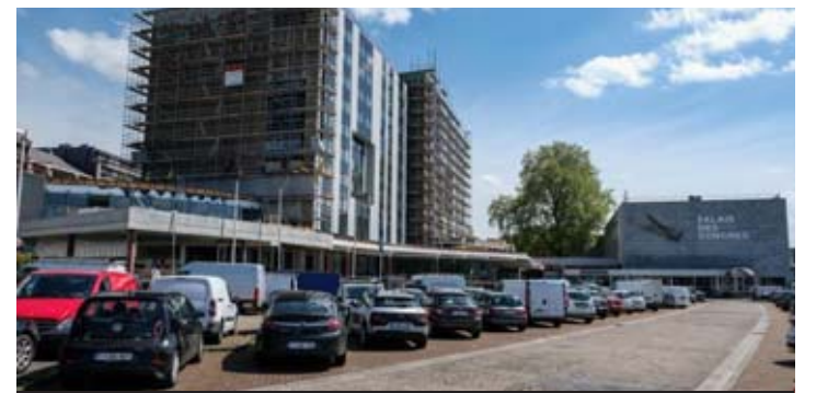
Une fois rénové, le parking sera réservé aux clients du Palais.

L'hôtel entièrement rénové, on attend maintenant que la société de gestion du palais des Congrès (IGIL) rénove à son tour le parking à l'avant et en sous-sol et qui est dans un piteux état.