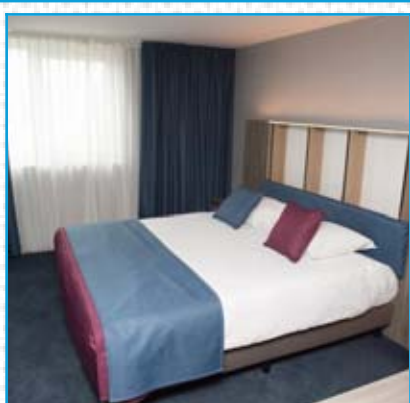
La chambre de base (28 m 2 ) avec petit bureau et une douche à l'italienne.