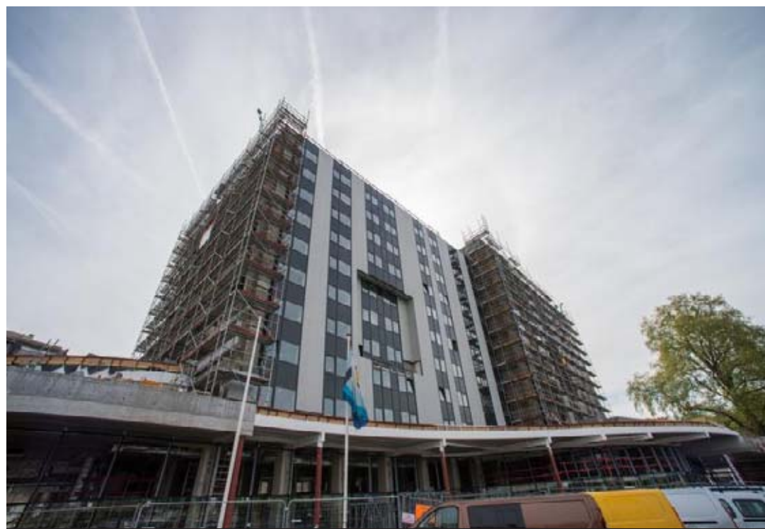
Les parements extérieurs sont pratiquement tous mis. Place à l'aménagement des chambres.

Avec 219 chambres, ce sera le plus grand de Liège