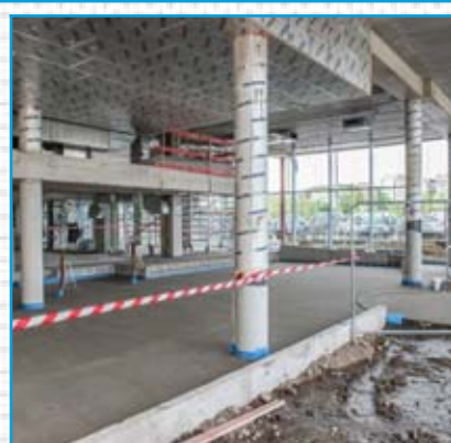
La nouvelle entrée côté place d'Italie qui abritera la réception.